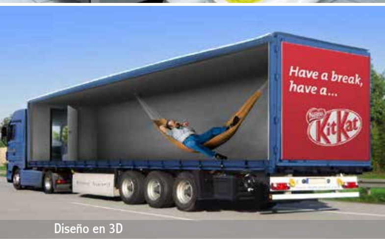
Diseño en 3D