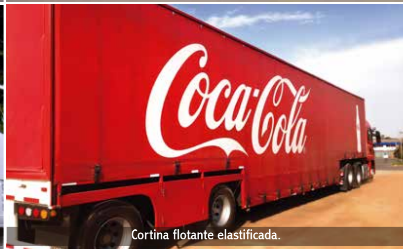
Cortina flotante elasticada.