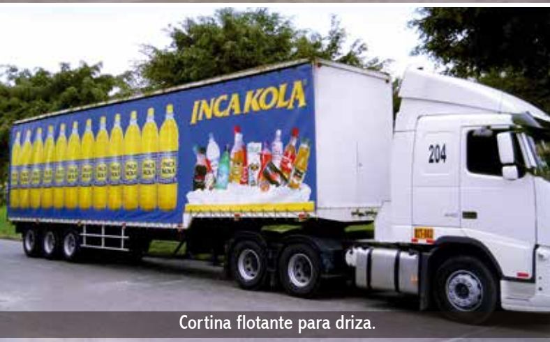
Cortina flotante para driza.