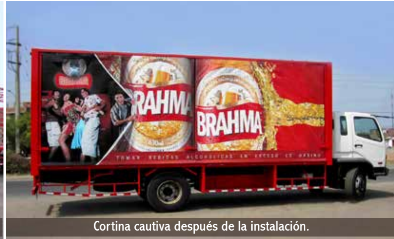
Cortina cautiva después de la instalación.