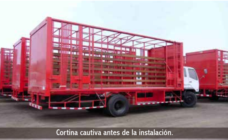
Cortina cautiva antes de la instalación.

Estas cortinas pueden ser en modelo cautiva, flotantes elasticadas o flotantes para driza. Contamos con un stock de accesorios como; rieles de aluminio y acero, rodillos de 2 y 4 ruedas de nylon y acero, hebillas tensoras con cinta de tiro, etc.